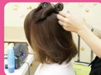
成人式当日のヘアサービス