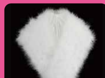
ショールサービス