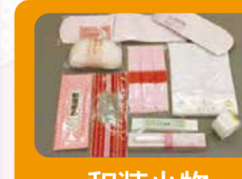
和装小物プレゼント