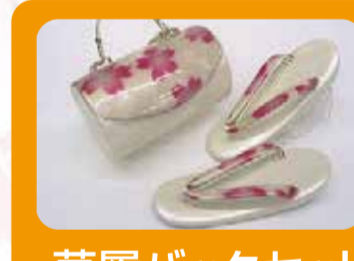
草履バックセットサービス