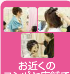
お近くのヨシヅヤ店舗で着付け・ヘア・メイクを行います