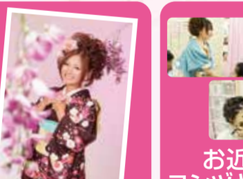
写真ご優待(当社写真・たま撮影に限り)