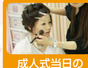
成人式当日のメイクサービス