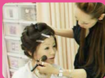
成人式当日のメイクサービス