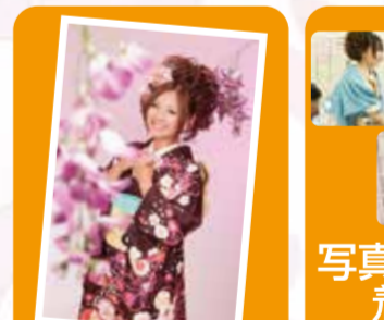
写真ご優待(当社写真・たま撮影に限り)