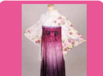
卒業式の袴無料貸し出し(6000円相当の袴)