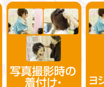
写真撮影時の着付け・ヘア・メイクサービス(当社写真・たま撮影に限り)