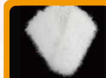
ショールサービス