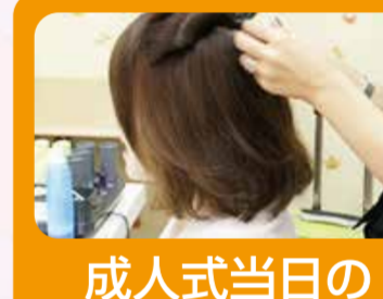
成人式当日のヘアサービス