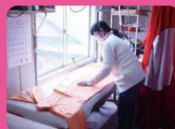
5年間お手入れ無料(振袖・帯・長襦袢)