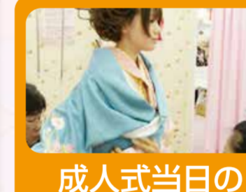
成人式当日の着付けサービス