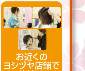
お近くのヨシヅヤ店舗で着付け・ヘア・メイクを行います