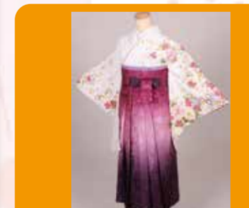
卒業式の袴無料貸し出し(6000円相当の袴)